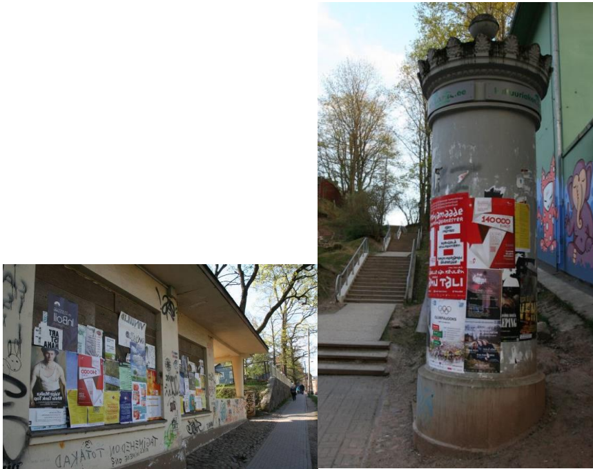
Kaasava eelarve reklaamplakatid reklaamtulpadel