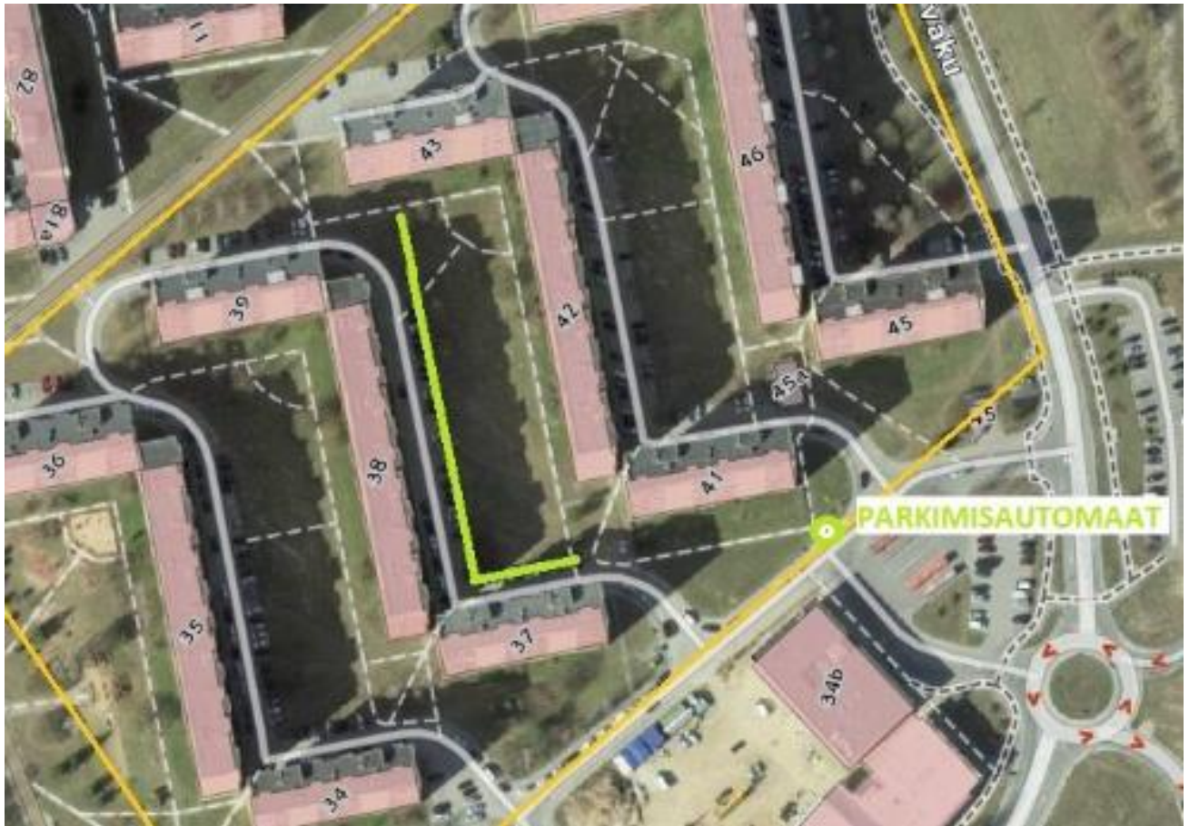
Kuvatõmmis Tartu linna kodulehelt