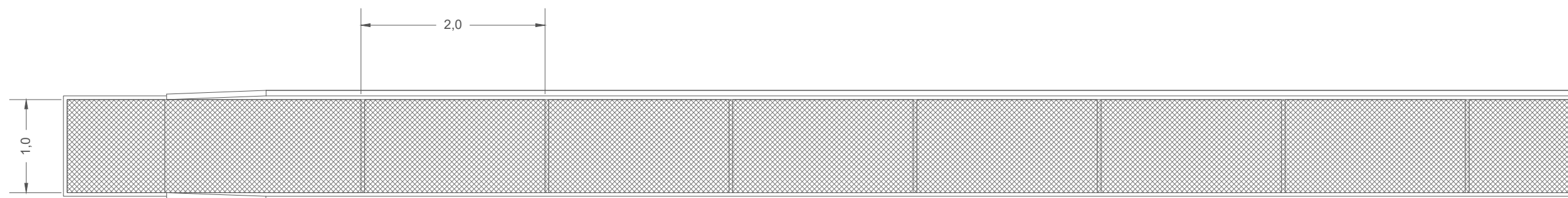
TÕSTETUD MATKARADA PEALTVAATES