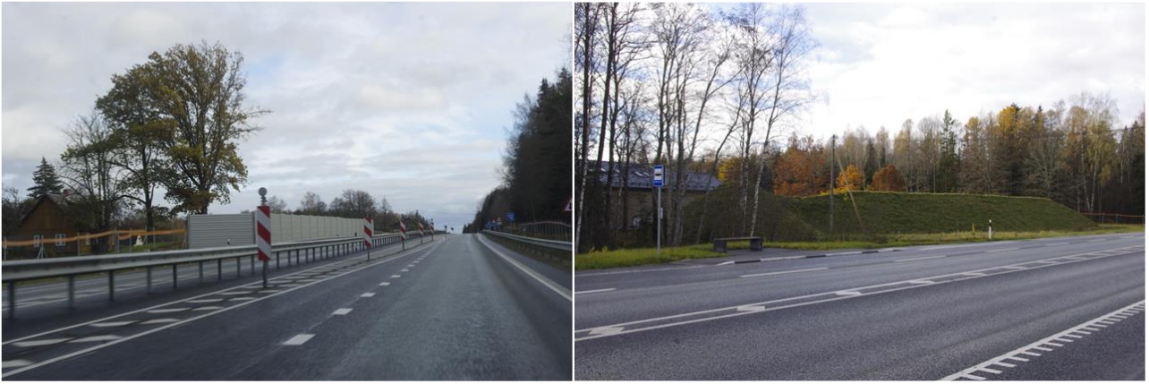
Müratõkkerajatised Tallinna-Tartu-Võru-Luhamaa tee ääres (Kardla ja Tüki küla, km 168...169)