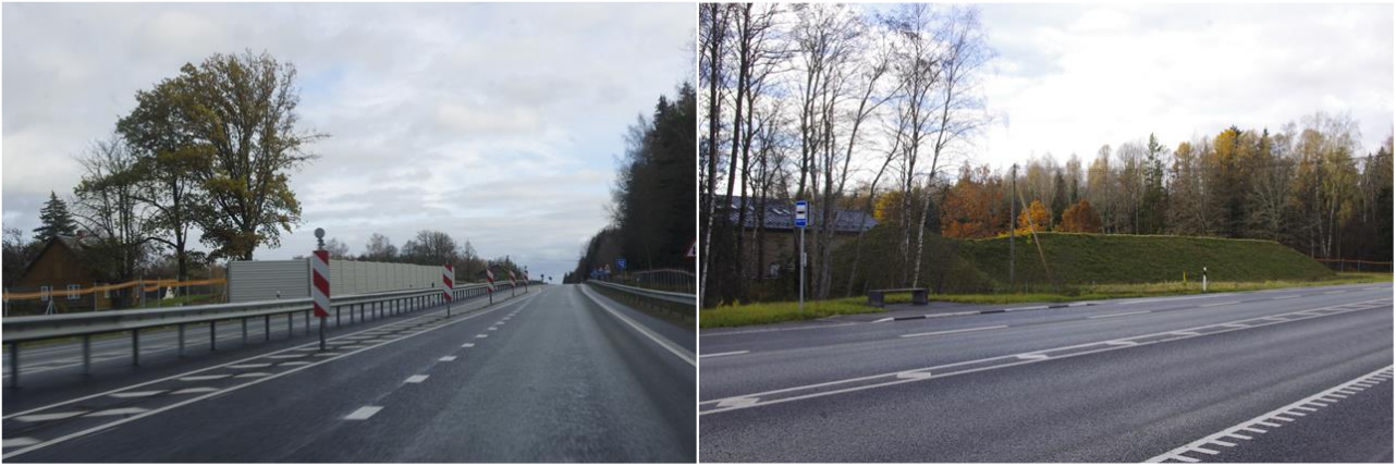
Müratõkkerajatised Tallinna-Tartu-Võru-Luhamaa tee ääres (Kardla ja Tüki küla, km 168...169)