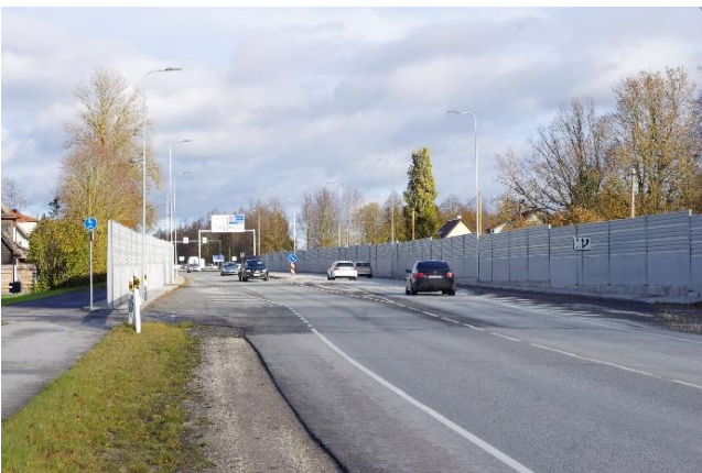
Müratõkkeseinad Jõhvi-Tartu-Valga tee ääres (Tartu linna ja Kambja valla piiril)