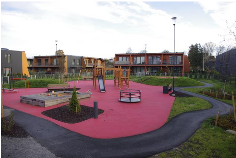
Näide puhke- ja virgestusalast (Kvissentali asumis), mis suhteliselt väiksest pindalast (< 0,2 ha) hoolimata täidab oma eesmärgi (foto: Hendrikson DGE, 2023)