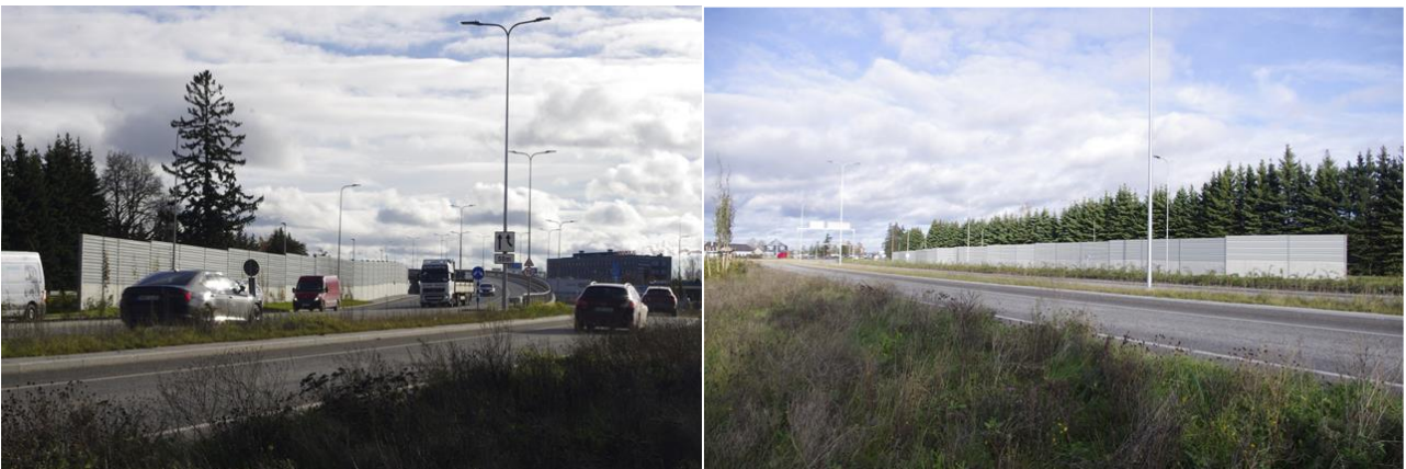
Müratõkkeseinad Tallinna-Tartu-Võru-Luhamaa tee ääres (Tartu linn, Tartu läänepoolse ümbersõidu II ehitusala)