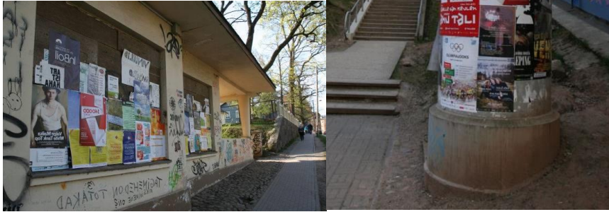
Kaasava eelarve reklaamplakatid reklaamtulpadel