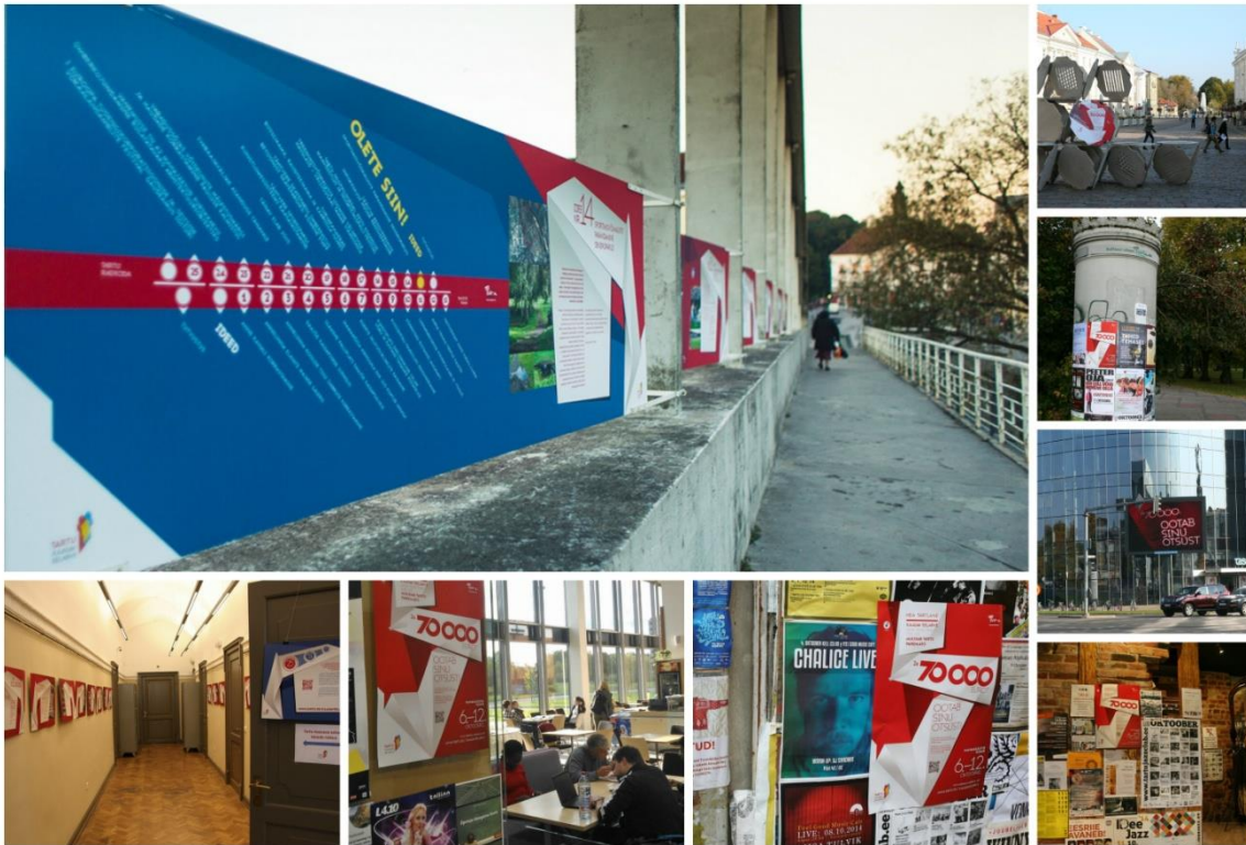
Ideede tutvustamine ja hääletusele kutsuvad reklaamid linnaruumis

Lisaks avalikule kommunikatsioonile toimus palju personaalset suhtlust ideede autoritega, et motiveerida neid oma ideedega edasi tegelma ja neile ka laiemat toetust püüdlema.