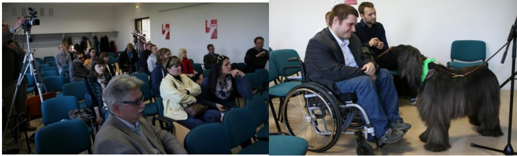
Lõpphääletusele pääsenud ideede tutvustusüritus