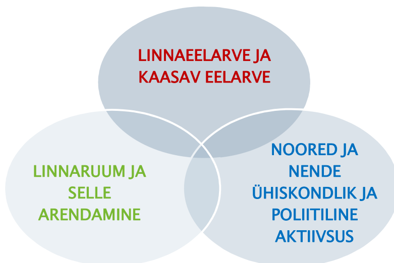
Joonis 1. Tartu kaasamise ja koostöö tegevuskava fookusteemad

Millised muutused on vajalikud, et kaasavasse eelarvesse lisanduks uusi lennukaid ideid ja kasvaks osalejate arv? Kuidas siduda see protsess paremini teiste kaasamisalgatustega nii linnaplaneerimises kui ka linnaeelarve kujundamisel? Poliitiline otsustuse tasand – kui suur peaks olema kaasava eelarve summa, mis motiveeriks linlasi aktiivsemalt osalema?