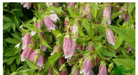
Campanula lactiflora 'Alba'