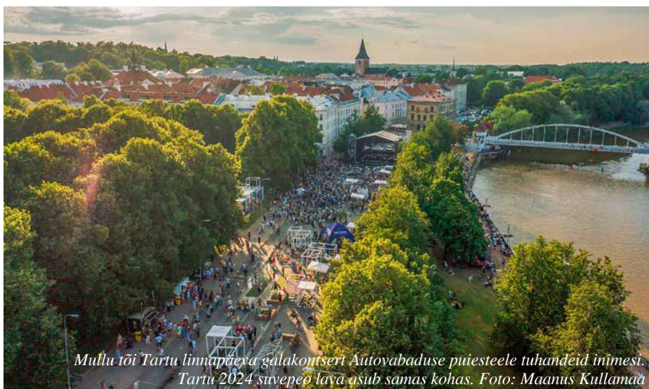
Mullu lõõ Tartu linnapäeva galakontsert Autovabaduse puiesteele tuhandeid inimesi. Tartu 2024 suvepeo lava asub samas kohas.