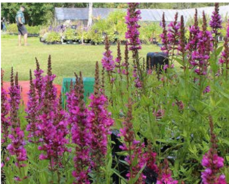
Eesti Aasta Püsilill 2023 harilik kukesaba 'Robert'.

Asjatundjatest koosnev kuueliikmeline žürii valis lõpphindamisele 40 kandidaadi seast välja 6 nominenti. Pileti „hindamiskarusellile“ pälvis ka aiandi külastajate poolt valitud ja rahva lemmikuks osutunud aedflokse sordiseeria Flame PRO sordid. Samuti sai esitada ühe nominendi ürituse korraldaja, kes pakkus välja mündilehise bergamo-